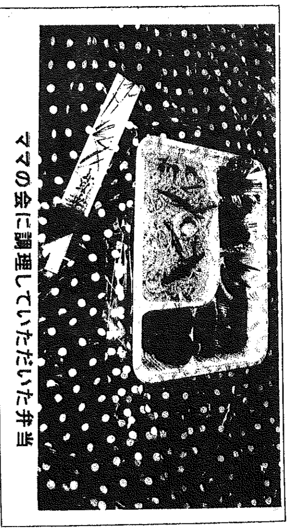
マスの会に調理していただいた弁当

今回は 1 月 29 日に実施し、対象者は 12 名でした。届ける際に近況等が自然と伺える等のメリットもあり、一人暮らしの方の『安心と安全』に多少なりとも寄与出来る事業と考えております。今後は『ふれあい弁当』の希望者が増える事を期待しています。【マスの会と社協ボランティアの皆様、ご協力有難う御座いました】