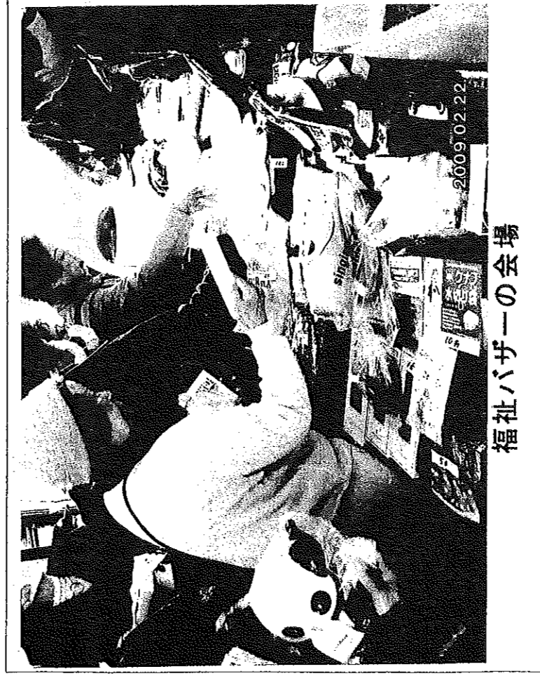
福祉バザーの会場