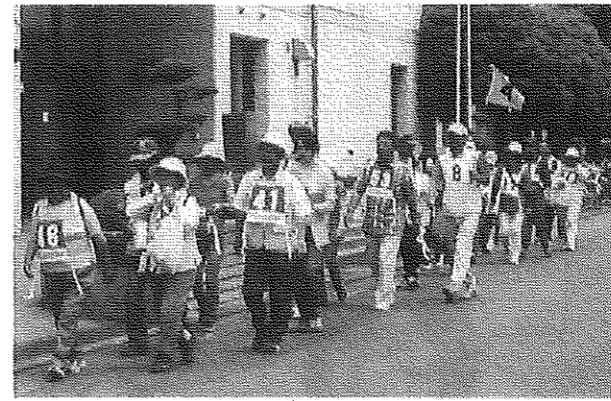
はーい、お疲れさまでした。

6月13日(土) 降らず照らずの歩け歩け日和、一三〇余名が参加しました。伊勢原市のあやめの里まで、8キロの行程を元気一杯で楽しんできました。