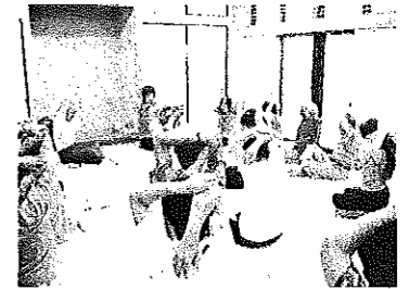
【健康第一！ヨイショ！】