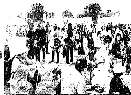
【めぐみが丘でも新しいおまつりが誕生しました】