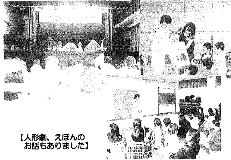
【人形劇、えほんのお話もありました】