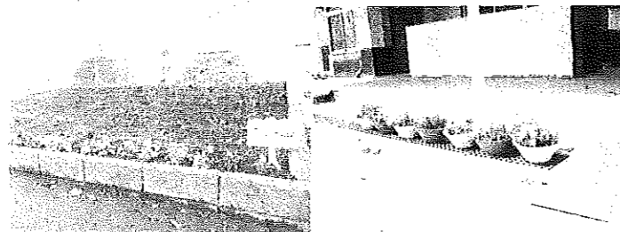
【寒さに負けずきれいに咲いています】