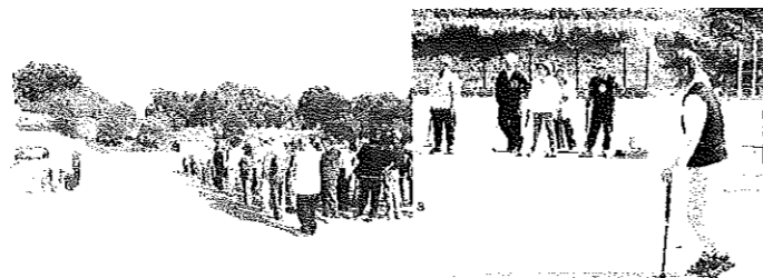
【いい汗掻いています】