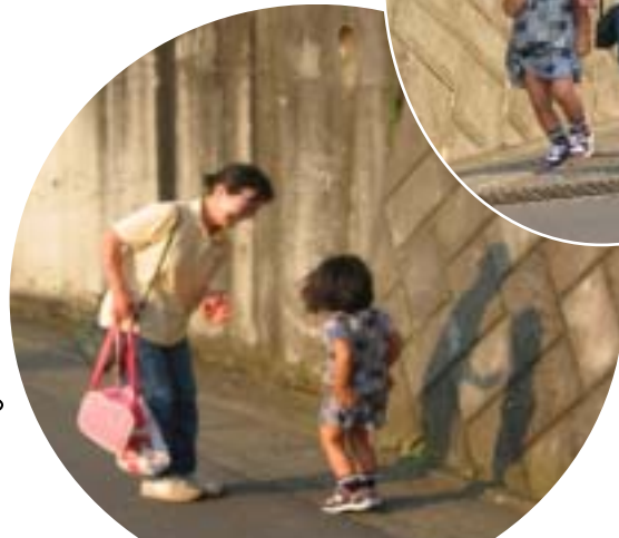
保育園からの帰り道

壁に映った影で影遊び おばちゃんとかげで鬼ごっ こ。「うわ~、タッチされち やうよー！」