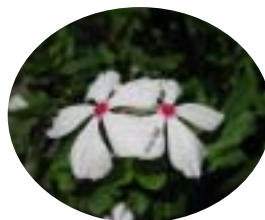
センターの花壇を彩る花々より