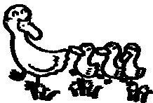
支援会員さん ママとじんちゃん

出産後心身ともに苦しかった時期のサポートはとても助かりました。今では支援会員さんとバイバイするとき大泣きする程なっています。