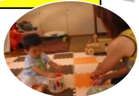
支援会員と遊ぶ じんちゃん