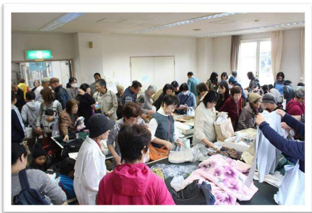
ふれあい広場 (バザー)