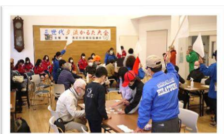
三世代交流かるた大会