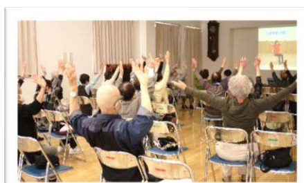
ふれあい交流サロン