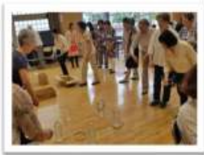
ふれあいサロン7月 輪投げゲーム