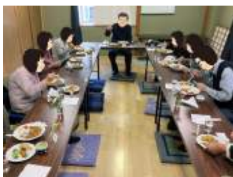
ひとり暮らし高齢者昼食会