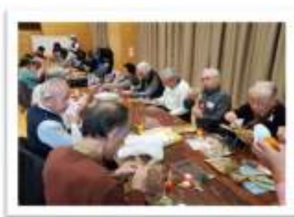
ふれあいサロン12月 お正月飾り作り