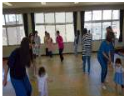
子育て広場のびのび