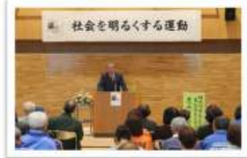
11月 社明運動講演会