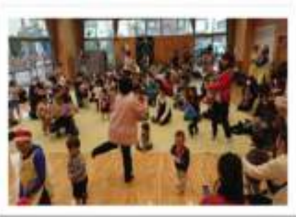
びよびよ 12月 音楽に合わせて踊ろう