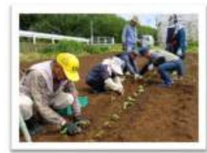
ふれあい農園 5月 枝豆の定植