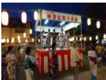
ふれあい納涼盆踊り大会