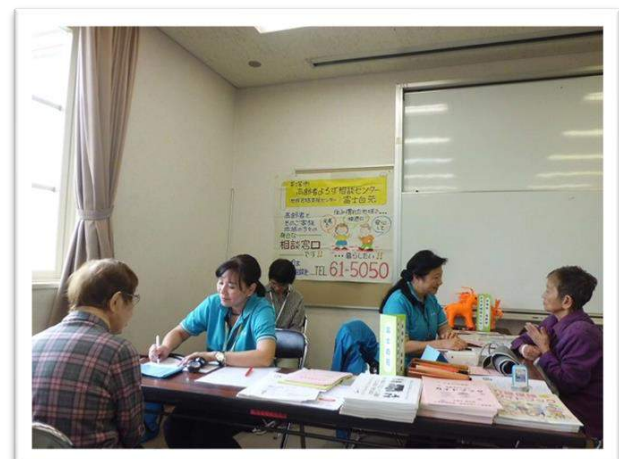
ふれあい広場 (地域包括支援センターの健康相談)