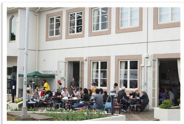
ふれあい広場 (喫茶・食事コーナー)