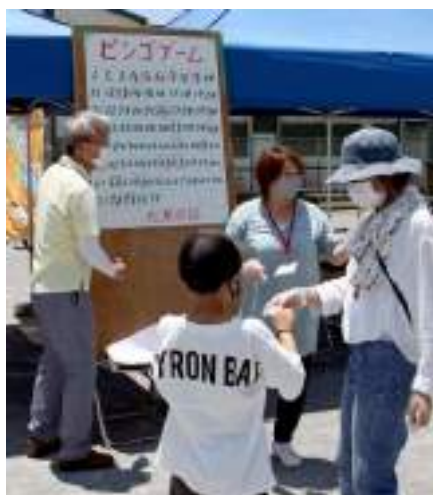
社明運動（ふれ愛ゲーム大会）