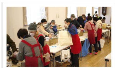
ふれあい広場・福祉バザー