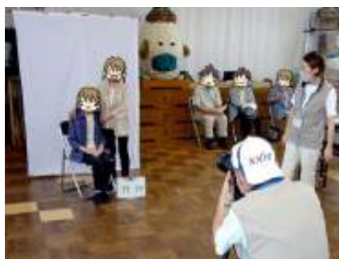
敬老会（長寿記念撮影会）