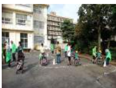
ふれあいフェスティバル(車いす体験)