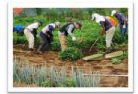
ふれあい農園 8月 落花生の収穫