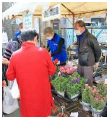
公民館まつり模擬店