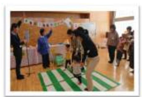
びよびよ 11月 交通安全教室