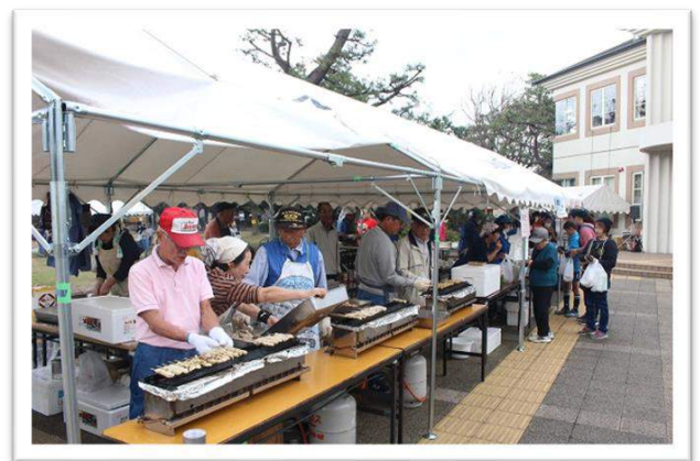
ふれあい広場 (各種団体による売店)