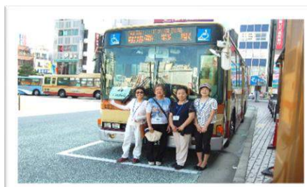
平塚駅バス停見守りボラ