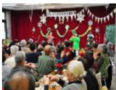
ふれあいクリスマス食事会