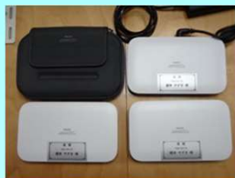
人工呼吸器用バッテリー