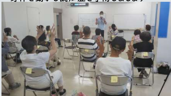
コグニサイズ教室の様子

最近、身体を動かしていますか？適度な運動は認知症予防になります。できなくなっても大丈夫！笑って、楽しく身体を動かしましょう。