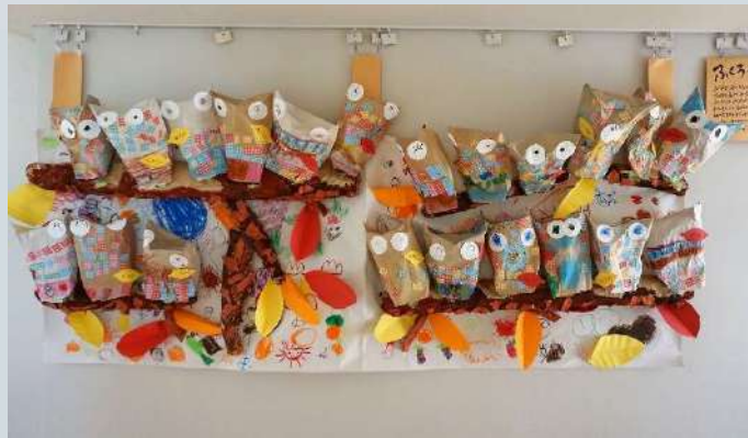
昨年度 湘南きらら保育園の出品作品「ふくろう」