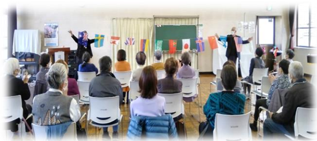
ひとり暮らし集い イベント(マジックショー) (令和4年11月)