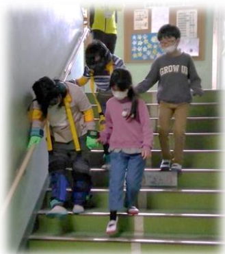
福祉の学びの場 (令和5年1月)