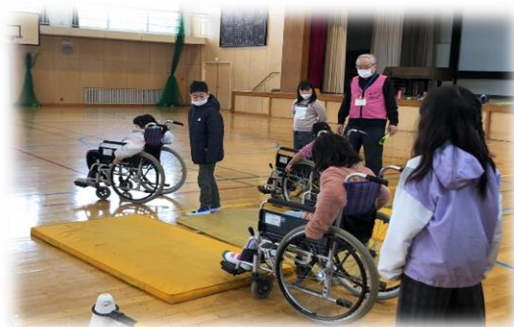
松が丘小学校3年生 高齢者疑似体験 車椅子操作法体験