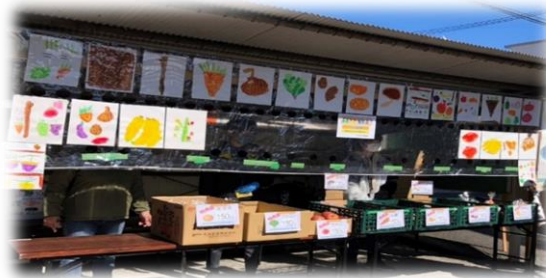
松が丘公民館まつり 保育園児の「野菜の絵」展示発表 (令和5年2月)