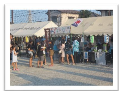
四之宮地区夏祭り大会(カキ氷販売)