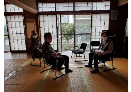
お友達との話し合い