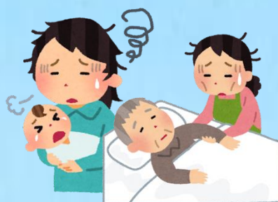
育児や介護に疲弊している