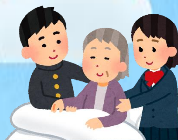
介護等によって自分の時間がとれない子供たち(ヤングケアラー)