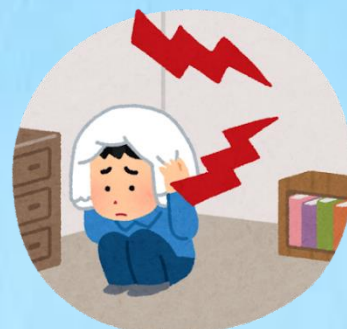
近隣トラブルで困っている