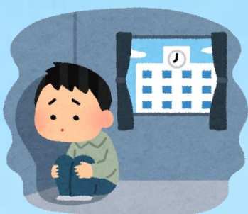
長くひきこもり、外出できない