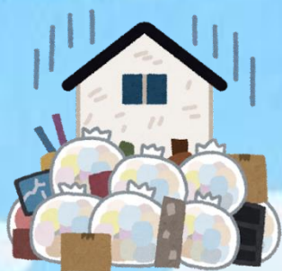
片付けられずに物があふれている

どこに相談したらよいかかわからない悩みごと、困りごとは、CSWまでご相談ください。地域の皆さんや関係機関、行政と協力して、解決に向けたお手伝いをします。