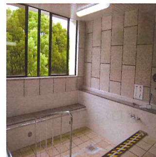
浴室(老人センター)