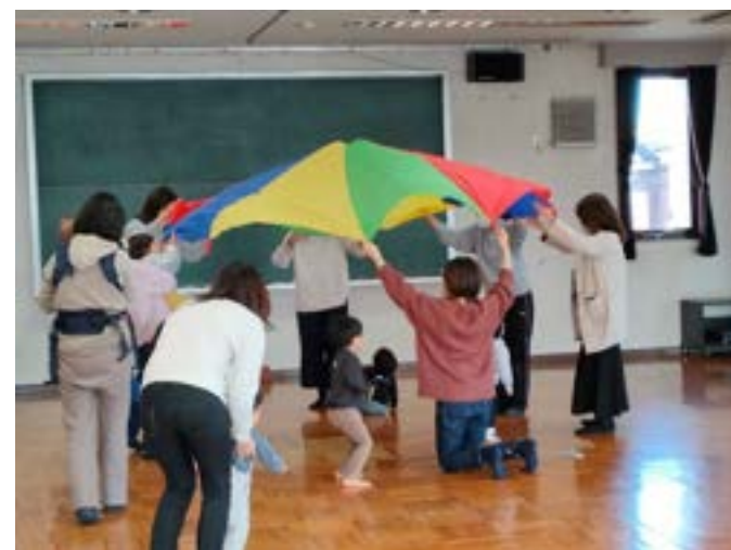
28 どんぐり (11 ページに掲載)