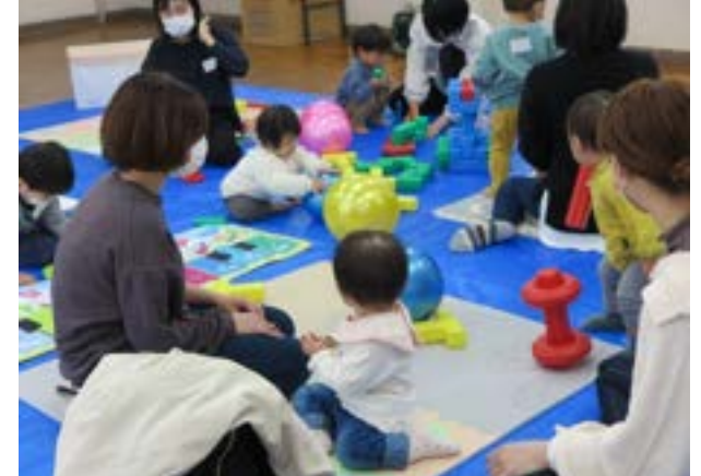
18 子育てるんるん (9 ページに掲載)