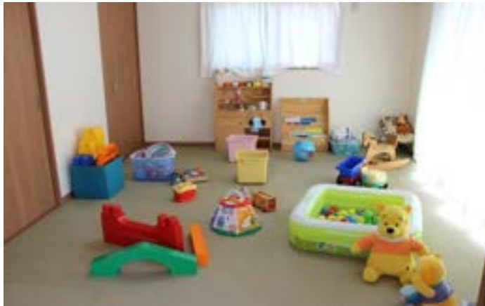
3 こひつじひろば (5 ページに掲載)