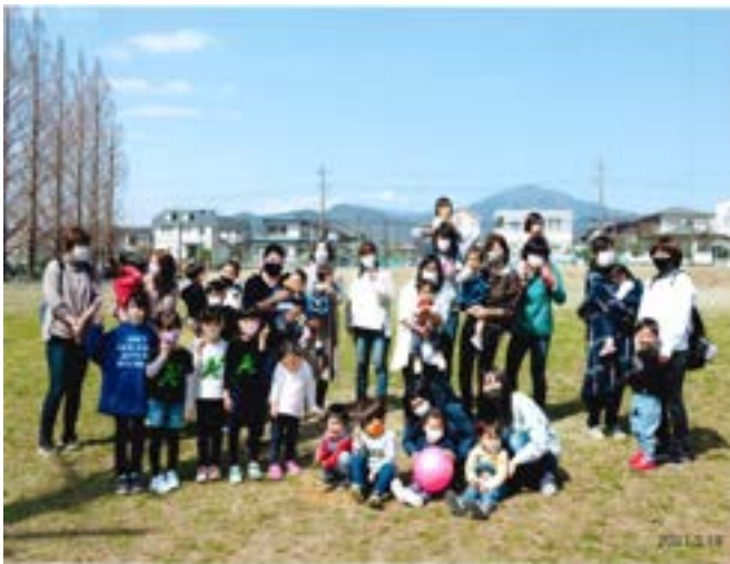
26 さくらんぼ (11 ページに掲載)