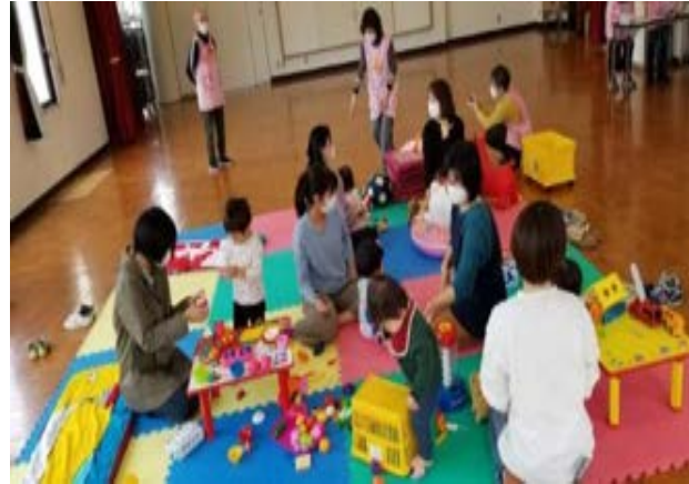
11 花水子育てサロン (7 ページに掲載)